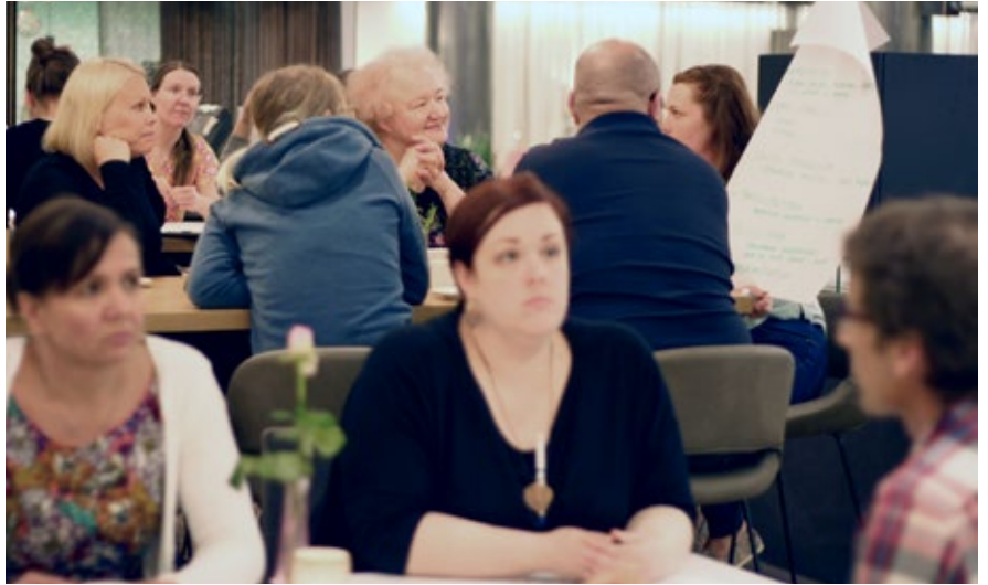
Toukokuussa pohdittiin alan asioita seminaarissa myös ryhmittäin.

”Valtuuskunta on osa liittoa. Liitto on se, joka vaikuttaa. Mutta valtuuskunnalla on vahva asema – ja ahkeralla jäsenellä vaikuttamismahdollisuuksia. Se-