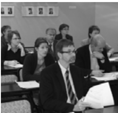
Valtuuskunnassa on 30 varsinaista jäsentä, 10 varajäsentä kaksi opiskelijajäsentä ja heidän kaksi varajäsentään.

Lisäksi valtuuskunnan kokouksiin osallistuivat liiton puheenjohtaja ja hallituksen jäsenet. Val-