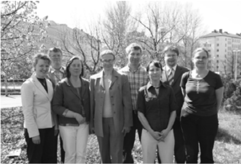
Eläinsuojeluvaliokunta kokouksen lomassa. Valiokunta järjesti Eläinlääkäripäivillä yleisölle iltatilaisuuden nimeltä Hyvinvointitutkimuksesta käytännön eläinsuojeluun, joka veti paikalle noin sata kuulijaa.

eläinsuojelun ja eläinten hyvinvoinnin teemanumeroon, josta saatiin paljon myönteistä palautetta.