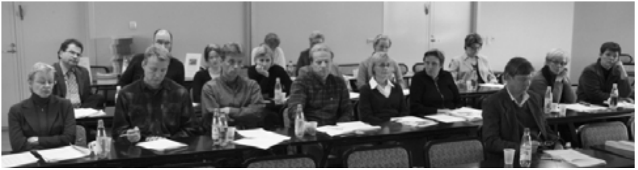
Valtuuskunnan syksyn kokous pidettiin Lääkäriliiton tiloissa, keväällä kokoonnuttiin Sokos Hotel Pasilassa.