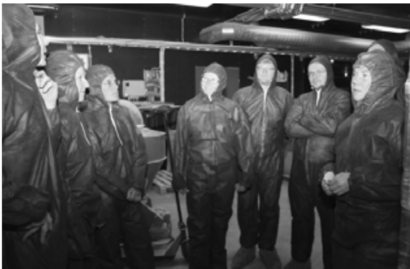
Eläinsuojeluvaliokunta jalkautui tutustumaan koekanalaan.

Valiokunta kokoontui vuoden aikana kolme kertaa. Valiokunta käsitteli kokouksissaan muun muassa S-ryhmän bonusjärjestelmän soveltuvuutta eläinlääkäri-