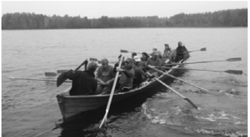
Vanajanlinnassa pidettiin koulutuspäivä YTAKE-asioiden tiimoilta 29. syyskuuta.

Kuudennen vuoden opiskelijoille pidettiin maksuton verokurssi 18. maaliskuuta. Kouluttajana toimi