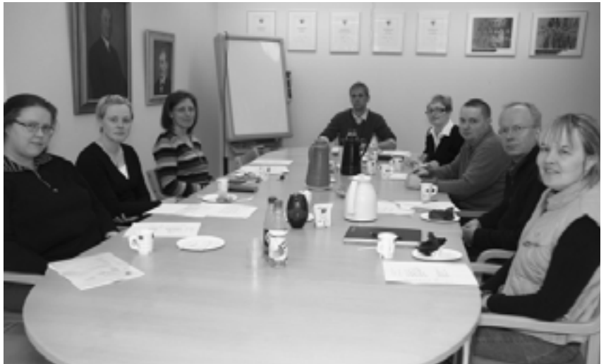
Koulutusvaliokunta urakoi jälleen kasaan monipuolisen ammattilaisohjelman Eläinlääkäripäiville. Valiokunnan kokoukset ovat niittäneet mainetta tehokkuudellaan.