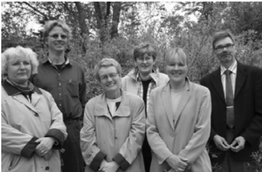
Eläinlääkärilehden toimitusneuvosto kokoontui viidesti. Suomen 13. vanhinta yhä ilmestyvä aikakauslehti on menestyksekkäästi kehitetty vastaamaan haasteisiin.

Liitto on A-lomat ry:n jäsen. Kertomusvuonna yksi liiton jäsen sai A-lomat ry:n jakamaa lomatukea. A-lomista julkaistiin kirjoitus Eläinlääkärilehdessä 2/2006. Tämän