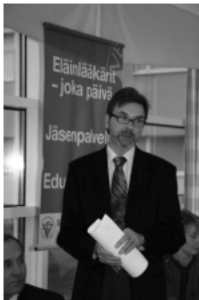
Puheenjohtaja alustaa tiedotustilaisuudessa, joka järjestettiin Iisalmissa valtuuskunnan kokouksen yhteydessä.