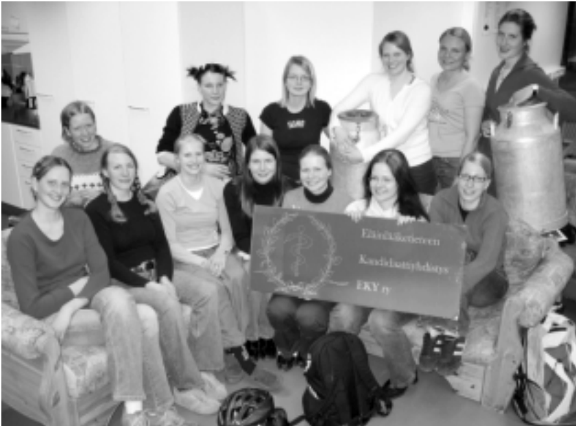
Liiton edustajat osallistuivat EKY:n iltoihin kahteen otteeseen vuoden aikana, kuvassa yhden illan osallistujia. Kuva Viikistä EE-talon Kuopio-nimisestä tilasta, jossa EKY toimii.