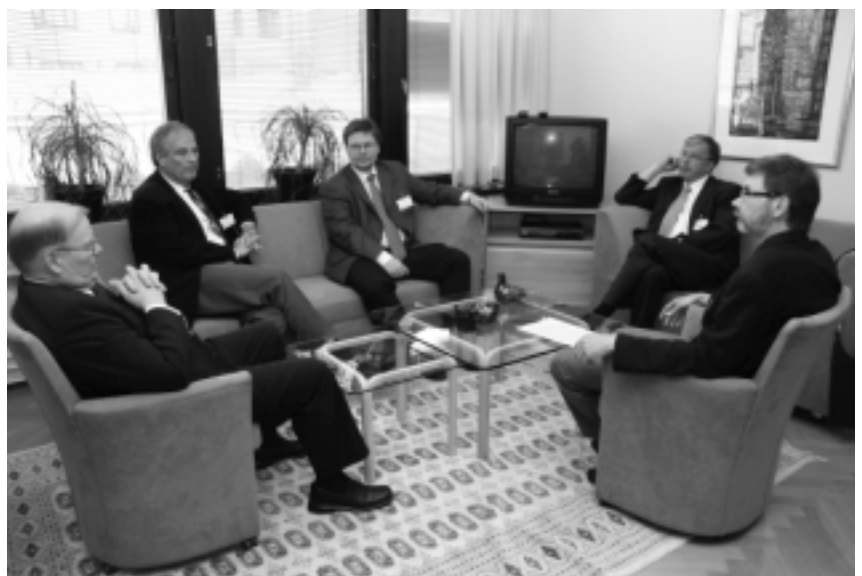
Liiton edustajat vaikuttivat moniin asioihin vuoden mittaan; kuntaministeri Hannes Mannisen luona käytiin syyskuussa kertomassa eläinlääkintähuollon alueellisista näkökulmista.

Kuntapuolella lääkäriyhdistyksille neuvotellun lääkärisopimuksen perusteella eläinlääkärien palkkoja korotettiin toimintavuonna 4,15