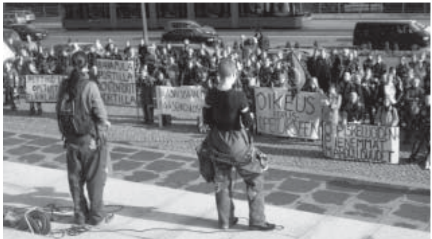
Opiskelijat olivat aktiivisia opiskeluresurssien turvaamisen ja lisäämisen puolesta. Hyvin järjestetty mielenosoitus pidettiin 7. lokakuuta.