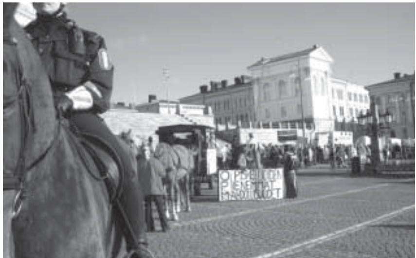
Eläinlääketieteen opiskelijoiden mielenosoituskulkue kokoontui Helsingin Senaatintorilla ja marssi Eduskuntatalolle. Liitto vaikutti asiaan neuvotteluilla kullisseissa ja julkistamalla oman tiedotteen.