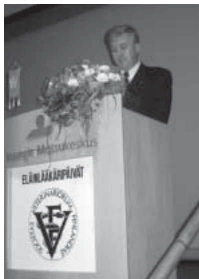
Puheenjohtajan katsaus vauhdissa Eläinlääkäripäivien avajaisissa. Päiville osallistui hiukan yli 700 henkilöä.