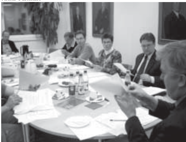
Hallitus työn touhussa marraskuussa. Kokous pidettiin tavanomaiseen tapaan liiton toimistolla.

Hallitus on toimintavuoden aikana kokoontunut 12 kertaa ja käsitellyt yhteensä 156 päätös- asiaa.