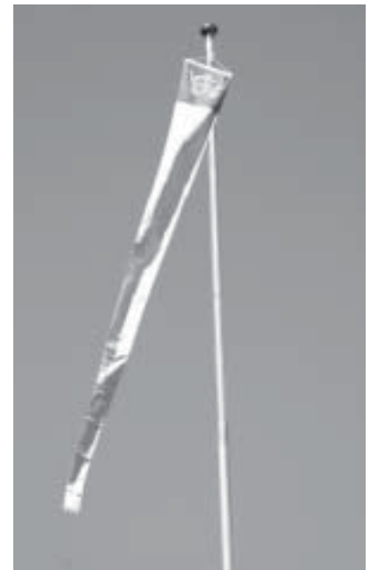
Liitolla oli myynnissä isännänviirejä.