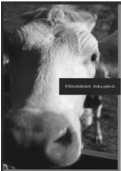
Vuonna 2002 ilmestyi uusi eläinlääkäreistä kertova esite, Eläinlääkärit. Joka Päivä.

Liitto teki 110-vuotisjuhlan kunniaksi esitteen eläinlääkäreistä.