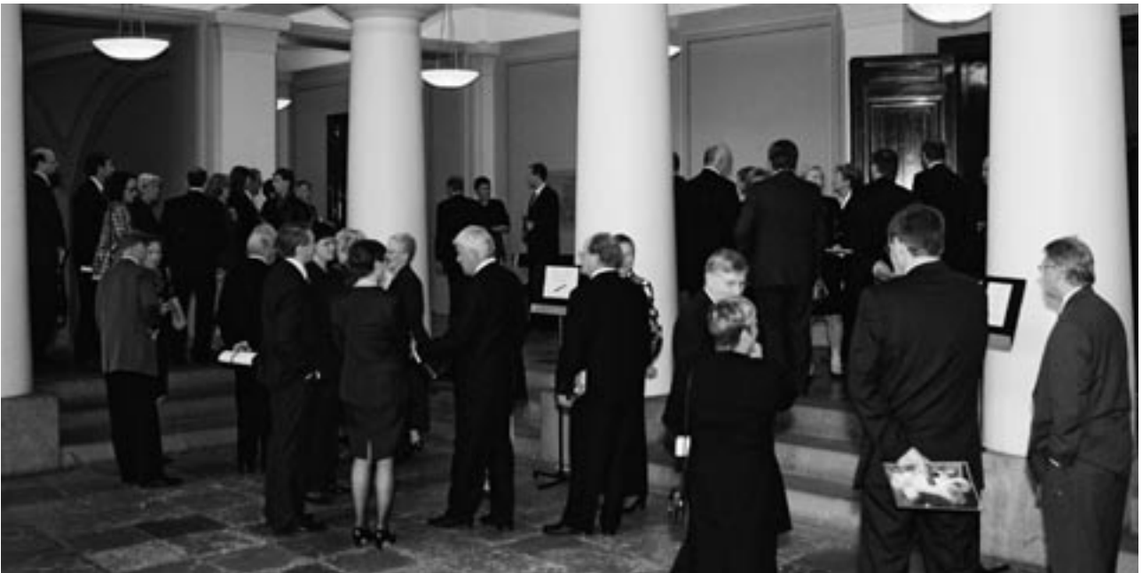
Eläinlääkäriliitto jubi 110-vuotistaipaleltaan Helsingin yliopiston juhlasalissa 5.10.2002. Kuvassa vieraita ennen tilaisuuden alkua.