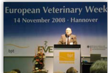
Eurooppalaiset eläinlääkärit koolla s. 650

Puheenjohtajan kynästä: Lakiuudistus etenee s. 664