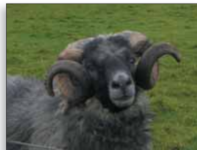
Tusina eläinlääkäreitä Färösaarilla s. 26