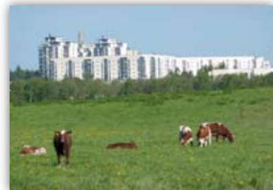
Eläinten hyvinvointikeskus toimii s. 562