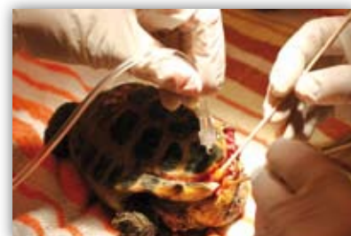
Eksoottisten lemmikkien tuntija s. 352