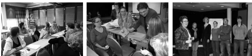
Valtuuskunnan kevätkokouksessa tehtiin Eläinlääkäriliiton tavoitesuunnitelma vuosille 2008–2010. Ideoiden ja ydinajatuksen kasaan saamisessa oli apuna konsultti.

lossa Helsingissä ja sääntömääräinen kevätkokous 18. toukokuuta Sokos Hotel Lakeudessa Seinäjoella. Sääntömääräinen syyskokous pidettiin 29. marraskuuta Lääkäritalossa Helsingissä.