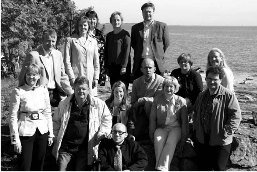
Hallitus ja toimisto viettivät yhteistä kesäiltaa illallisen merkeissä kesäkuussa hallituksen kokouspäivänä.