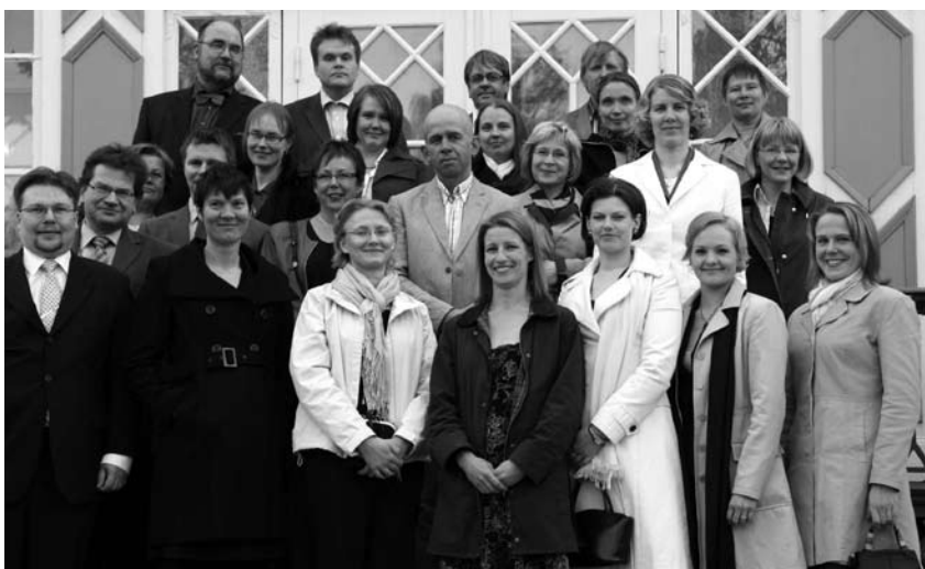
Valtuuskunnan kevätkokouksen osana käytiin Seinäjoen kaupungin vastaanotolla.

Vuonna 2007 valittu valtuuskunta kokoontui kertomusvuoden aikana kolme kertaa. Järjestäytymiskokous pidettiin 12. tammikuuta Lääkärita-