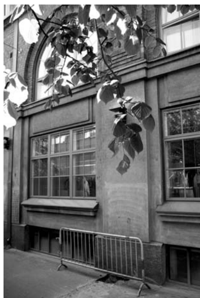
Jäsentiedotteessa 3/08 kerrottiin liiton Aleksis Kiven kadulta ostamista uusista toimitiloista.

Jäsenille suunnattua tiedotusta olivat jäsentiedote ja kotisivujen jäsenivut. Uusitut kotisivut julkaistiin vuoden mittaisen projektin päätteeksi tammikuun lopulla ja tavanomaisen hionnan jälkeen kokonaisuus on kehittänyt liiton