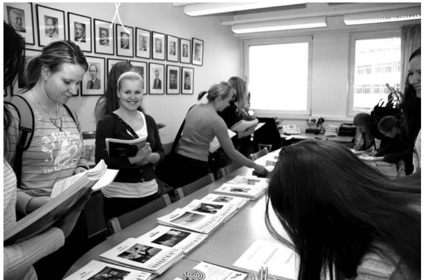
Ensimmäisen kurssin opiskelijat tutustuivat liiton toimintaan ja tiloihin tammikuussa.

Liiton toimistolla työskenteli vuoden aikana yhteensä kahdeksan henkilöä, joista liiton puheenjohtaja oli puoliaikainen ja liiton talouspäällikkö etätöissä. Lisäksi liiton toimiston yhteydessä toimivassa liiton omistamassa Fennovet Oy:ssä työskenteli kaksi henkilöä. Liiton toimihenkilöstö pysyi pää-